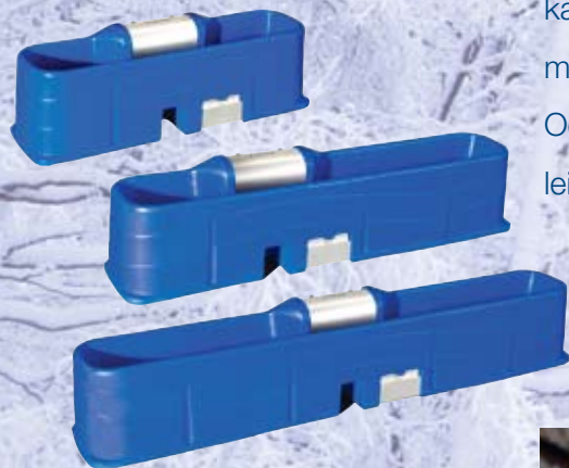
Drinkbak WT7, WT10 en WT12