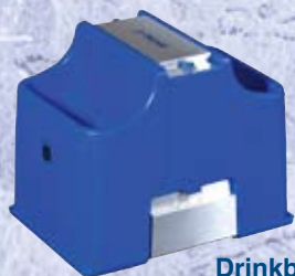
Drinkbak type SC2