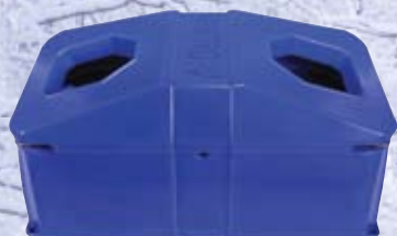
Geïsoleerde drinkbak met kleppen